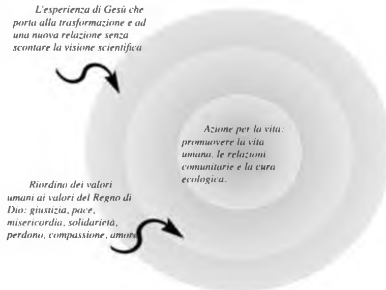
Figura 2: Il mondo attraverso il paradigma del Regno cristiano di Dio o la Spiritualità di GPIC.

Il cristianesimo non nega l'indagine scientifica, ma sostiene che la scienza non ha la capacità di rispondere a tutte le domande, specialmente a quelle di valori e di significato. Tuttavia, quando la scienza si limita al proprio regno, essa è un partner di dialogo necessario per aiutare a costruire uno scenario più giusto tra le persone, le comunità e la creazione in generale.